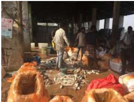
印度水產卸貨分級碼頭

印度政府除了熱衷於提升印度海產品出口附加值，2016 年也宣布新規則：漁業與養殖業將 100% 接受海外和個人對產業的投資，旨在促進經濟發展，開放漁業市場，外資可以從世界各地帶來先進技術和最佳經驗。該政策將適用於印度養漁業、養殖業和養蜂業。希望可以引進世界先進的養殖技術和最佳實踐方案，來幫助水產品養殖業實行最好的成本效益模式。