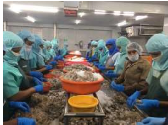
印度蝦子加工出口廠

庫 315 萬公頃，漫灘濕地 20 萬公頃，高地湖泊 72 萬公頃，每年生產水產品約 80 萬噸。隨著水利灌溉系統的發展，在溝渠和溝渠淹沒區等水體進行圍網養殖是可行的。近年隨著河流、溪流和其他水道上修建了愈來愈多的大壩，水庫數量也在逐年增加，有必要通過以養殖為基礎的漁業開發來挖掘這些水體的漁業生產潛力。憑藉豐富的地理資源，印度漁業在滿足水產品需求方面一直發揮著舉足輕重的作用。