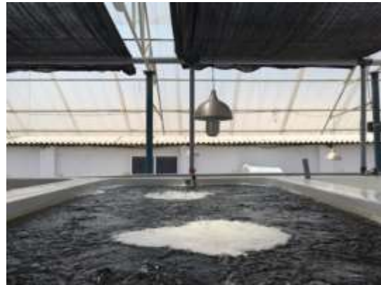
印度種苗孵化養殖場

失率之急速冷凍整廠設備、食品加工機、包裝機」。此外，印度天然豐富的養殖環境，也很適合臺灣養殖水產品業者或食品加工業者前往投資設廠。