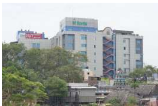
清奈 Fortis 醫院

清奈地區： 清奈被稱為印度的健康首都，有許多多功能或專科醫院，估計每天吸引超過 150 位國際病人到清奈治療。清奈在印度國內觀光醫療市場約佔有 30% 到 40%，來自國外的觀光醫療市場佔有比率更高達 45%。