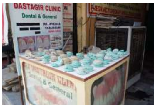
海德拉巴路邊牙醫攤位

印度提供觀光醫療服務的醫院以私人醫院和阿育吠陀醫療為主，印度的 Apollo、Fortis、Manipal 及 Max 等私人醫院，除了擁有良好聲譽外，並在印度主要城市都有分院。