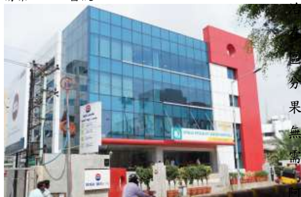
清奈 Apollo 癌症專科醫院

清奈成為觀光醫療重鎮的因素包括成本較低、幾乎沒有等待期，還有各專科醫院完善的醫療設施等。清奈各醫院共有約 1 萬 2,500 張病床，其中只有一半為用來提供清奈人使用，其餘為提供印度其他地區和外國人患者使用，清奈的牙科診所亦吸引許多遊客