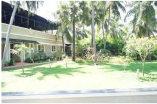
印度阿育吠陀度假治療中心