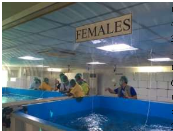
印度某水產養殖中心

印度目前蝦子外銷量名列全球第一，水產養殖總量全球第三（若不算水草海藻，名列第二），印度水產發展局（MPEDA）及印度漁業署在養殖業的規劃相當完整，除蝦子之外，亦開始引進高經濟價值魚種如石斑魚、金目鱸魚、龍蝦、螃蟹等。目前多項政府採購及民間軟硬體設備及建設案均在內部積極討論建制中。目前養殖大邦如南方邦、西孟加拉邦、塔米爾納度邦仍以內陸淡水池塘養殖為主力，古吉拉特邦及喀拉拉邦則較多箱網養殖。